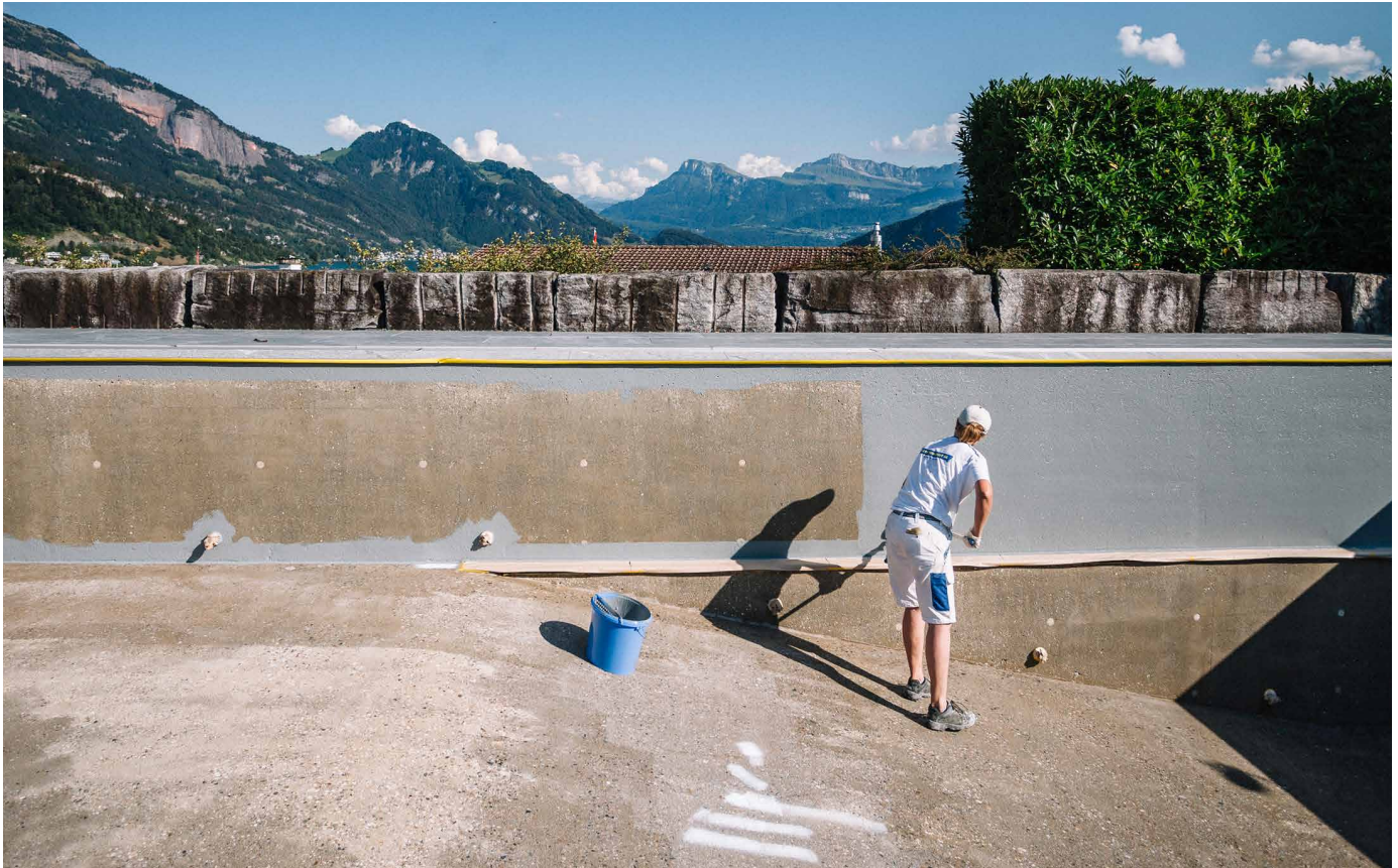
Frau mit Roller beim Beschichten auf Parkdeck

Graffitis und andere Schmierereien, Kratzer von Autos, Spuren von Wildpinklern, von Kälte, Feuchtigkeit und Salzen: Mauern und Beton im öffentlichen Raum müssen viel aushalten. Unterhalt und Sanierungen sind entsprechend zeit- und kostenaufwändig.